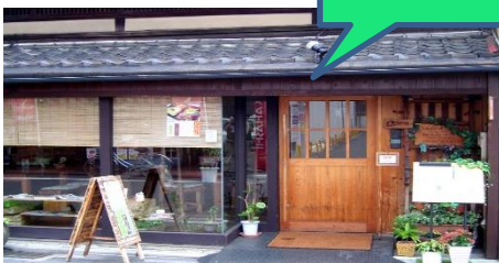
ジョイントほっとは町屋風のレストラン