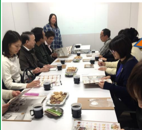
共生シンフォニーさんのクッキー工場の見学

昨年11月に、ふれあいのみんなで、同じように障害を持つ人たちが働くレストランやお菓子づくりをしている工場などの見学をしてきました。 京都の社会福祉法人てりてりかんぱにいが運営しているレストラン、舞鶴にある舞鶴福祉会の本格的なフレンチレストランのぼのぼの屋にいつてきました。町屋風の庶民的なレストランと海を見下ろせる高台にあるフレンチレストランです。 また、滋賀県のクッキーの大量生産をしている共生シンフォニーのオートメーション化されたクッキー作りも健げくしてきました。行き届いた衛生管理に感動した人も多く、今後のふれあいの運営に活かしていきたいと思いました。